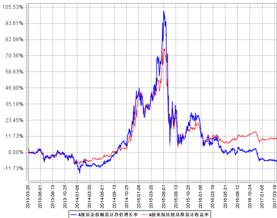
A级基金份额累计净值增长率与同期业绩比较基准收益率的历史走势对比图